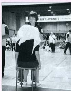
—赤十字救急法フェスタ 2011出場—