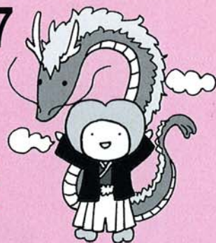
神崎町社協イメージキャラクター「ふくちゃん」