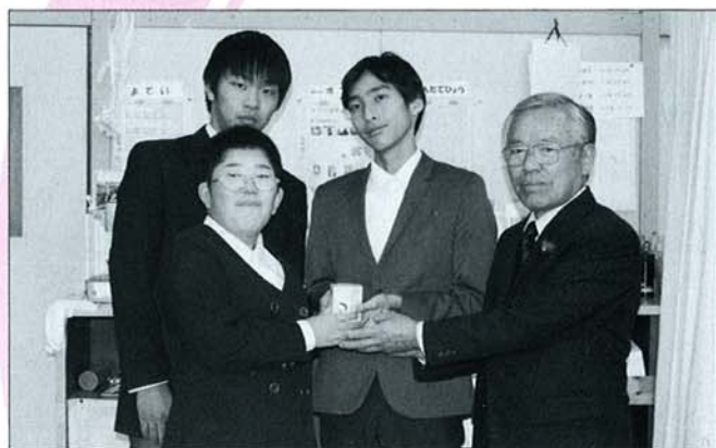
●香取特別支援学校