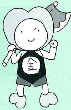
神崎町社協イメージキャラクター「ふくちゃん」