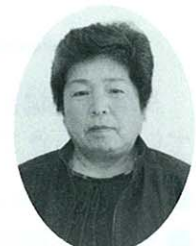
石井 きよ 郡区