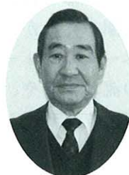
宮崎 和 新区