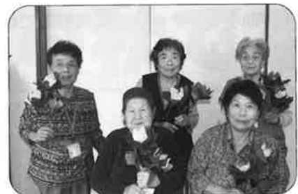
趣味創作活動アートフラワー