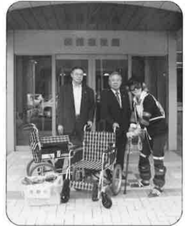
高柳ボラ連会長より：この疑似体験により「思いやりの心」が芽生えればと考えています。