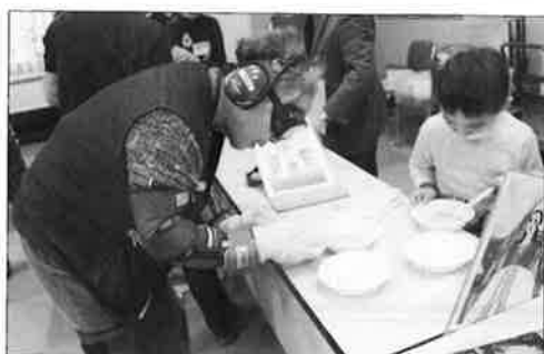
『うらしま太郎』 高齢者疑似体験