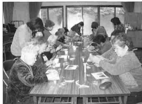
ミニデイサービス

※経理区分ごとの収入・支出額については、繰越活動における収支を除く当該年度の収支状況です。