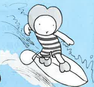
神崎町社協 イメージキャラクター「ふくちゃん」