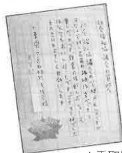
▲香取特別支援学校の生徒から後日、手紙をいただきました。

マリーゴールドは香取特別支援学校高等部の生徒たちが一生懸命育てた苗です。今年も夏の暑さに負けず大きく育ててほしいと思います。ふれあいプラザにお越しの際は、成長するマリーゴールドも是非お楽しみください。