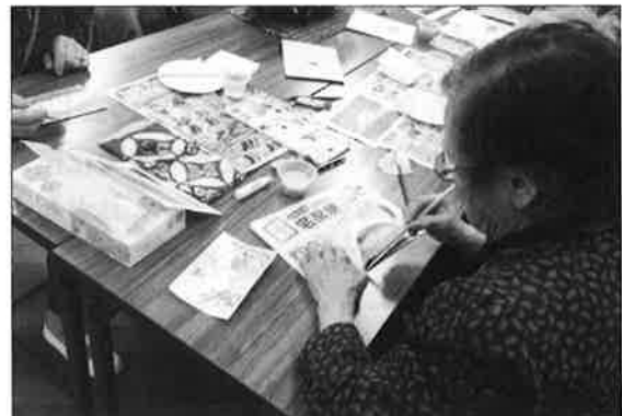
ミニデイサービス

※経理区分ごとの収入・支出額については、繰越活動における収支を除く当該年度の収支状況です。