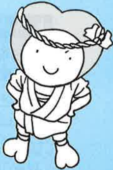
神崎町社協イメージキャラクター「ふくちゃん」