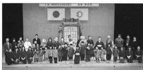
第11回社会福祉大会