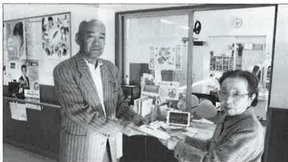
神崎町体育協会ゴルフ部