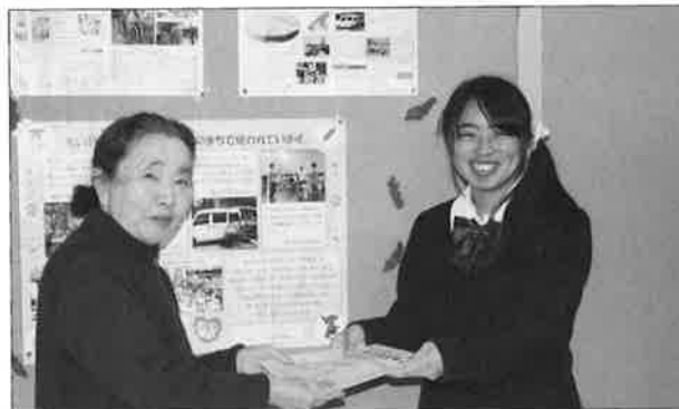
●香取特別支援学校