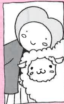
神崎町社協イメージキャラクター：ふくちゃん