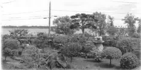
美しい植木の向こうは霞ヶ浦