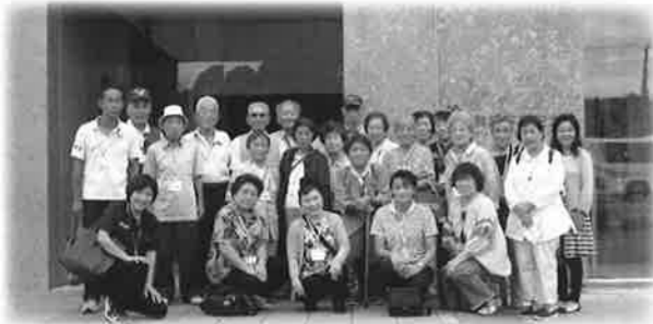
9月7日(本2・本3・本4・本5)の皆さん