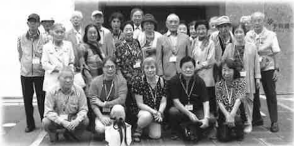
9月14日(本1・郡・今・高谷・四季の丘の皆さん)