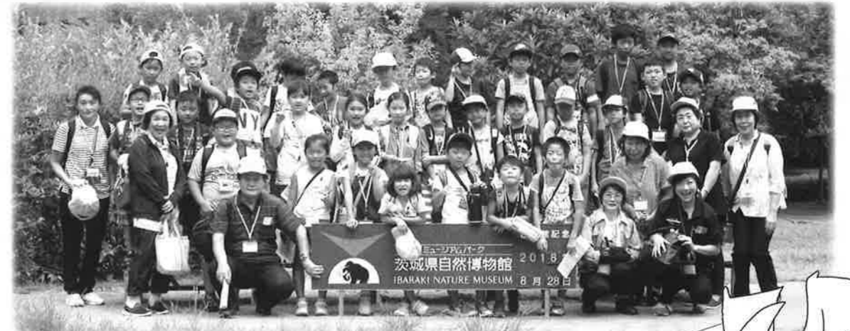
ミュージアムパーク茨城自然公園にて記念撮影

また、屋外では化石の発掘や水遊びを楽しみながら、人と自然の関りや共生の大切さを学びました。