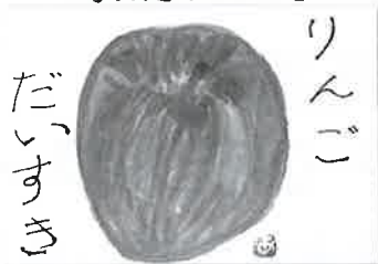
作 椿 明子様