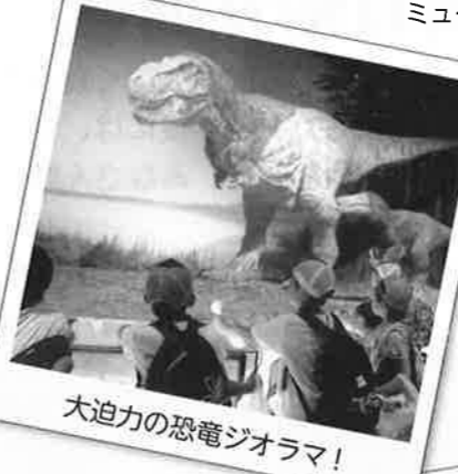
大迫力の恐竜ジオラマ!