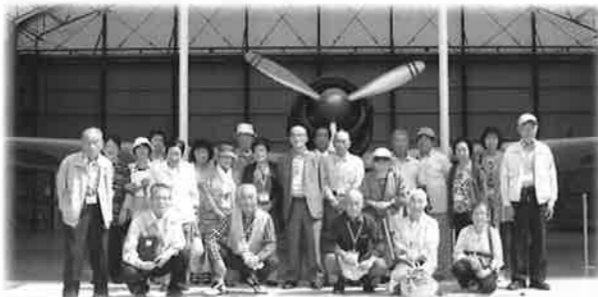
9月13日(並木・小松・向野・松崎・神宿)の皆さん