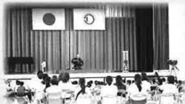
初めての落語に笑いの渦でした