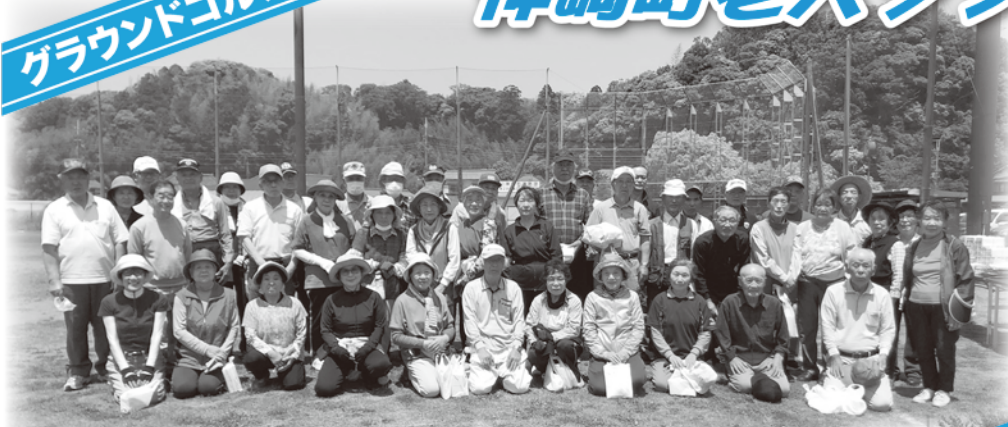
グラウンドゴルフ参加の皆さん