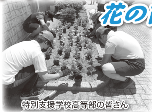
特別支援学校高等部の皆さん