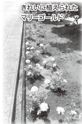
きれいに植えられた マリーゴールド

今年も千葉県立香取特別支援学校と手をつなぐ親の会の方々にご協力を頂き、神崎ふれあいプラザのプール脇花壇に花の苗木(マリーゴールド)を植栽いたしました。黄色やオレンジ色など300ポットの苗木が、縦にきれいに植えられ、施設を利用して通る方々を楽しませています。