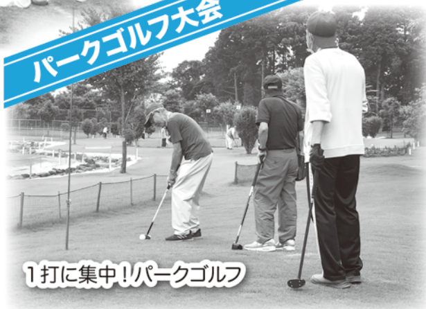
1打に集中!パークゴルフ

5月にグラウンドゴルフ大会を参加者52名で、6月にはパークゴルフ大会を37名の参加で開催しました。両日ともに晴天に恵まれ、好成績が続出、ホールインワンも出るなど、普段の練習の成果が発揮されました。