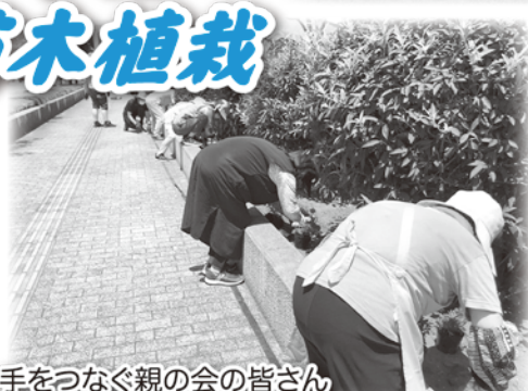
手をつなぐ親の会の皆さん