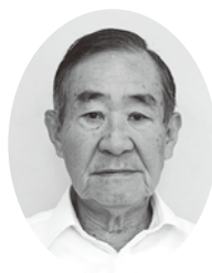
宮崎 和 新区