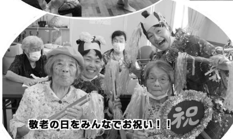
敬老の日をみんなでお祝い!!

テイルームくすのきでは、ご利用者さん達に楽しんでいただけるように、季節に応じたレクリエーションや交流会などの行事も行っています。