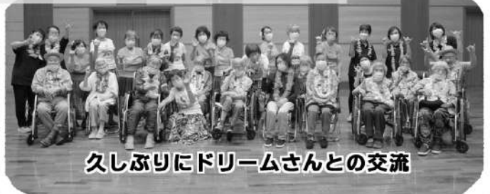
久しぶりにドリームさんとの交流