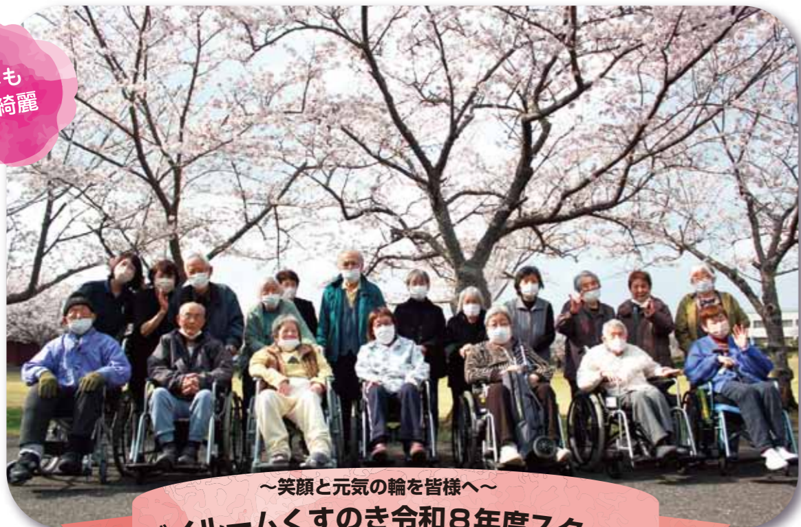
～笑顔と元気の輪を皆様へ～